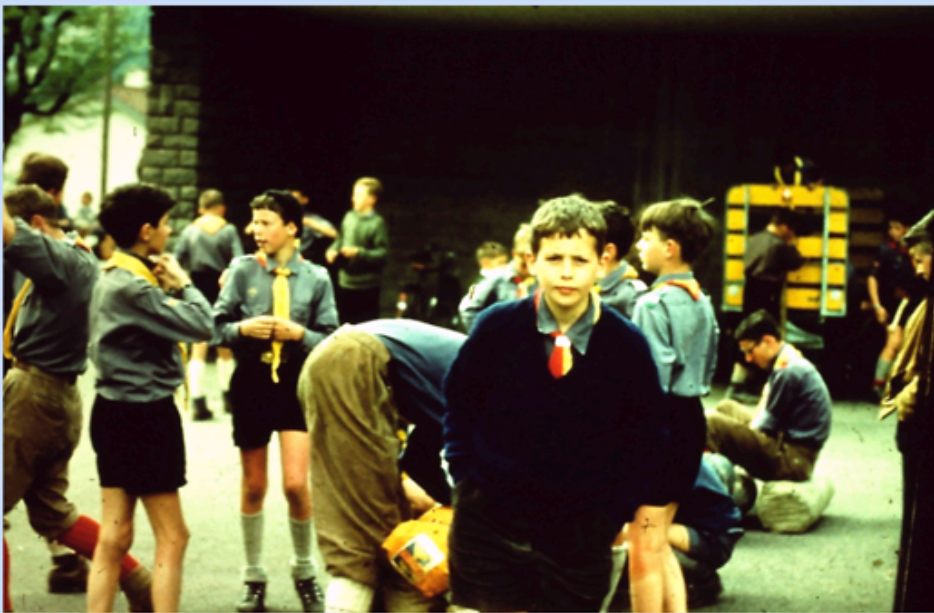
Warten auf den Zug beim Bahnhof Silenen-Amsteg.