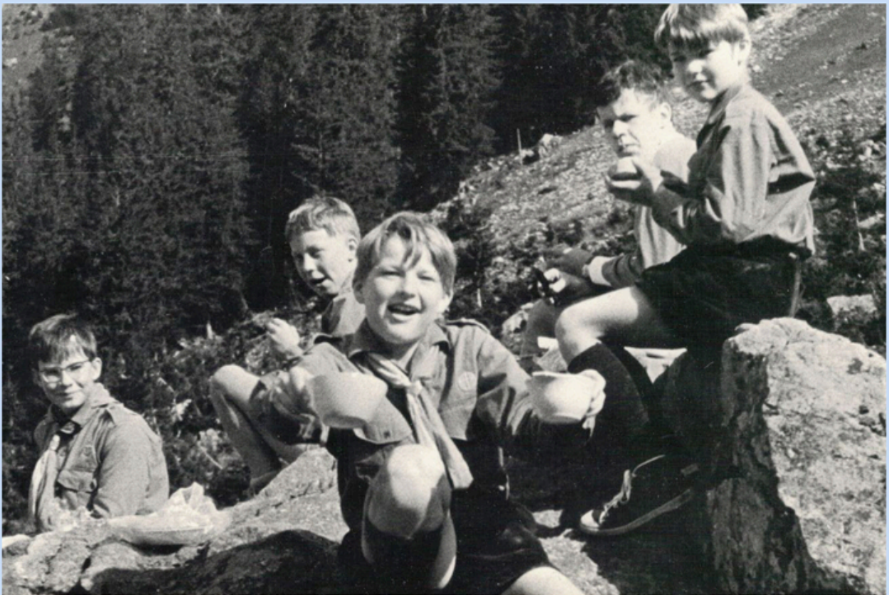
Pfingstlager 1968 am Golzernsee im Maderanertal.