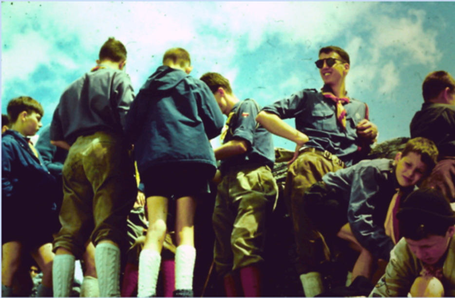
Sonntagswanderung zur Windgällenhütte 2031 müM mit Rast neben der Hütte.

Aufstieg mit Sack und Pack vom Bahnhof Silenen-Amsteg 544 müM zum Golzernsee 1411 müM. Das erste Pfingstlager mit der JS Glockenhof.